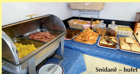
Snídaně – bufet

PLÁŽ – Privátní pláž cca 150 m od hotelu. ZDARMA je zajištěn plážový servis (1 slunečník a 2 lehátka nebo křesla na pokoj).