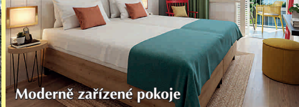
Moderně zařízené pokoje