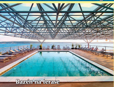
Bazén na terase