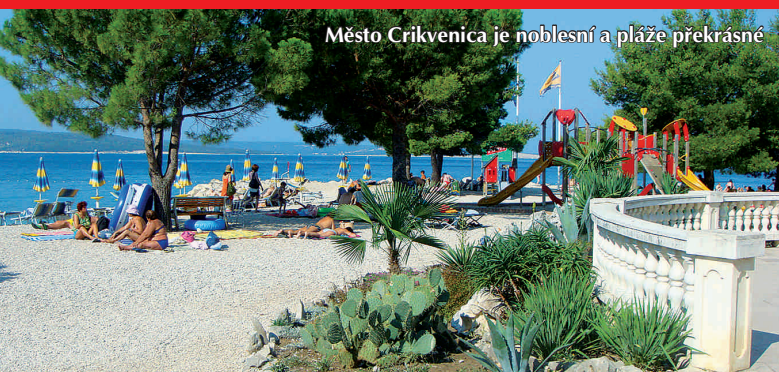
Město Crikvenica je noblesní a pláže překrásné

Jadran pomáhá všem, kteří mají astma, problémy s dýcháním, klouby, trpí migrénou, bolestmi zad, kožními chorobami nebo si potřebují pročistit organismus.