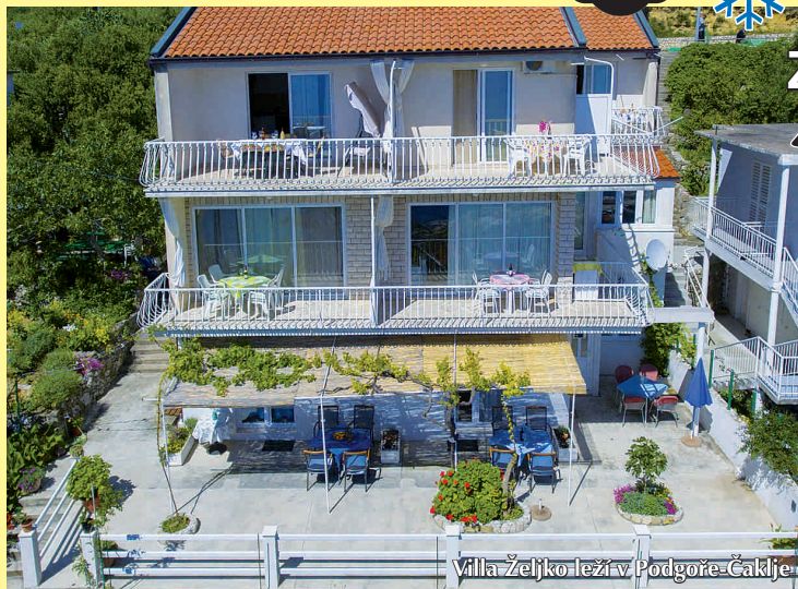
Villa Željko leživ, Podgora-Čaklje