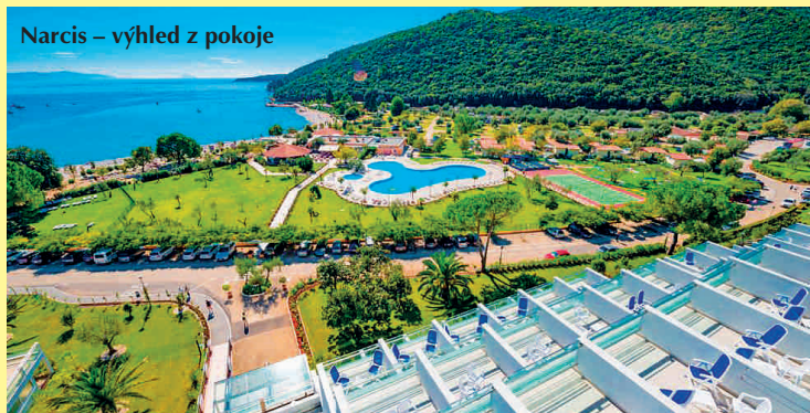
Narcis – výhled z pokoje